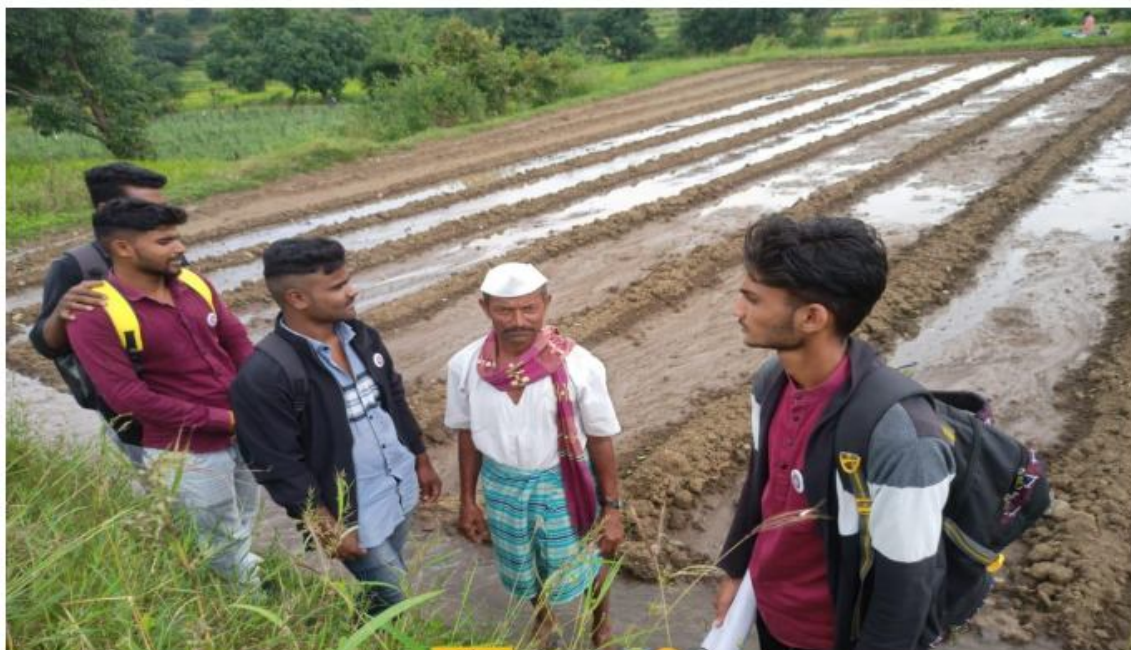
NSS Officer along with volunteers and College students discuss with farmers while Shivar Ferry campaign.