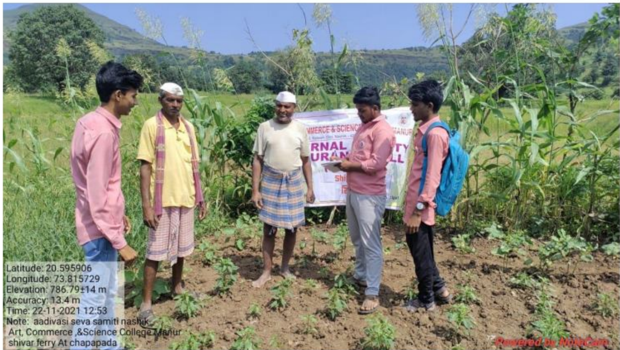
NSS Volunteers giving information about Pradhan Mantri Kisan Daan Yojana .