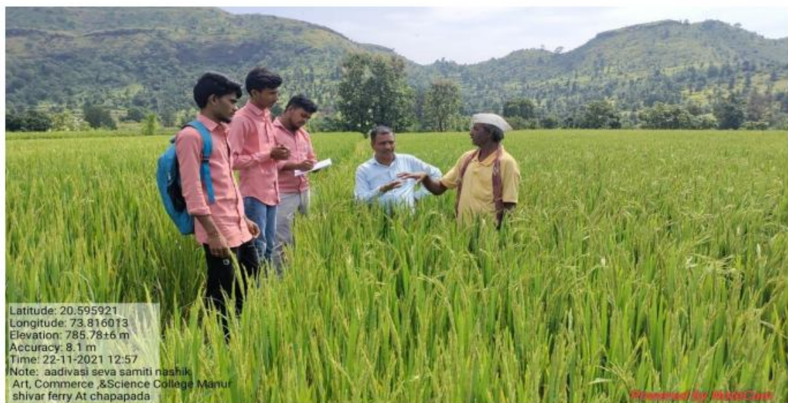
NSS program officers and volunteers Guide about Pradhan Mantri Kisan Bima Yojana (PM Crop Insurance Scheme) to Farmers while Shivar Ferry .