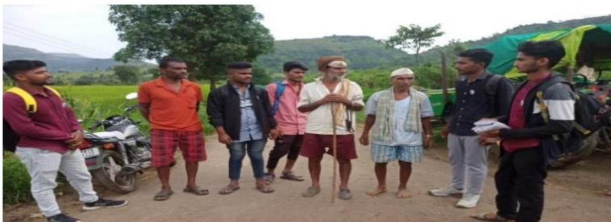
Volunteers of NSS informing the farmers of Virshet village about crop rotation and e-crop inspection scheme.