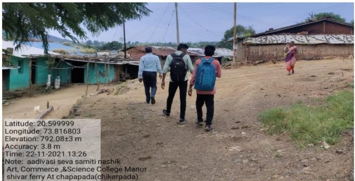
Visit to Chapa Pada village by NSS Officer and NSS Volunteers and College Students.