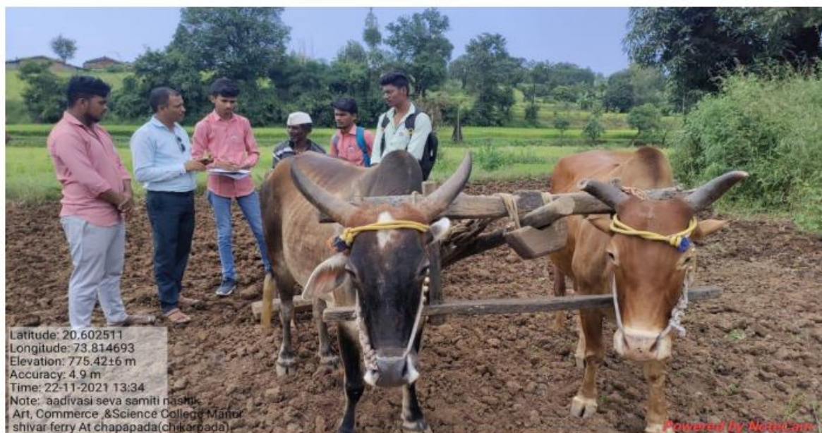
NSS volunteers aware to farmers about traditional implements and technical implementation in Agriculture.